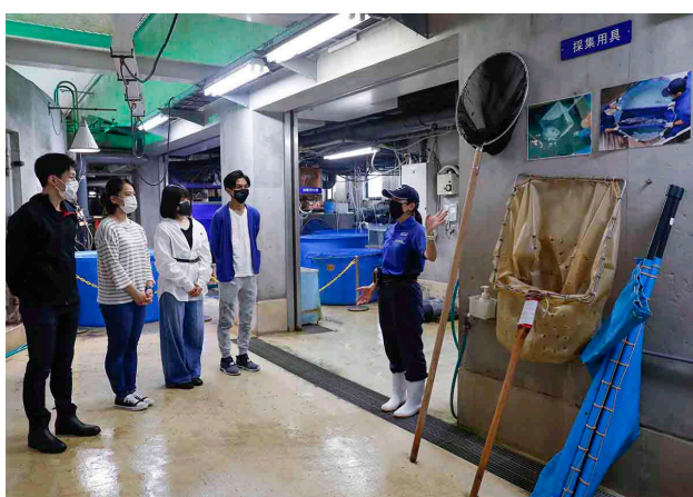
トピカルアイランド裏方見学

https://www.kamogawa-seaworld.jp/event/event_info/8371/